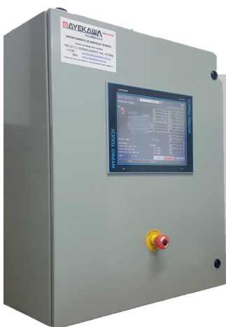
PLC Ó CAJA DE CONTROL MYPRO

En Mayekawa contamos con la capacidad y experiencia para desarrollar proyectos de refrigeración automatizados desde el centralizado de la operación de los compresores por medio de un sencillo PLC hasta el control y supervisión total de los procesos en planta por medio de una red de autómatas.